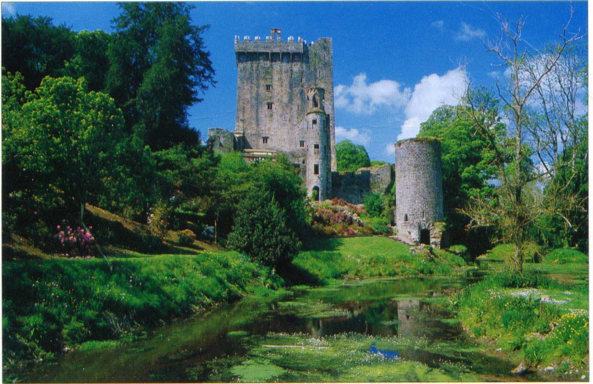
BLARNEY CASTLE, IRELAND